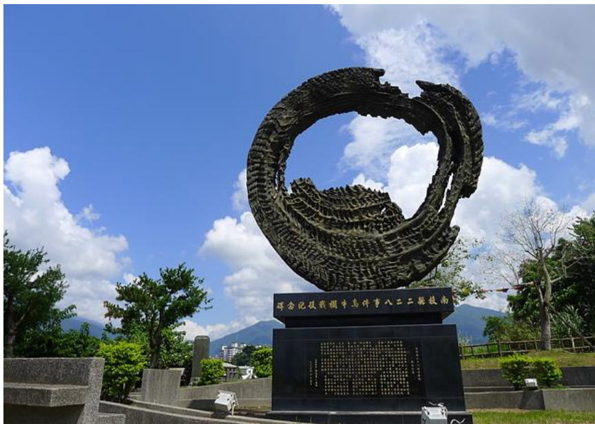
烏牛欄戰役紀念碑